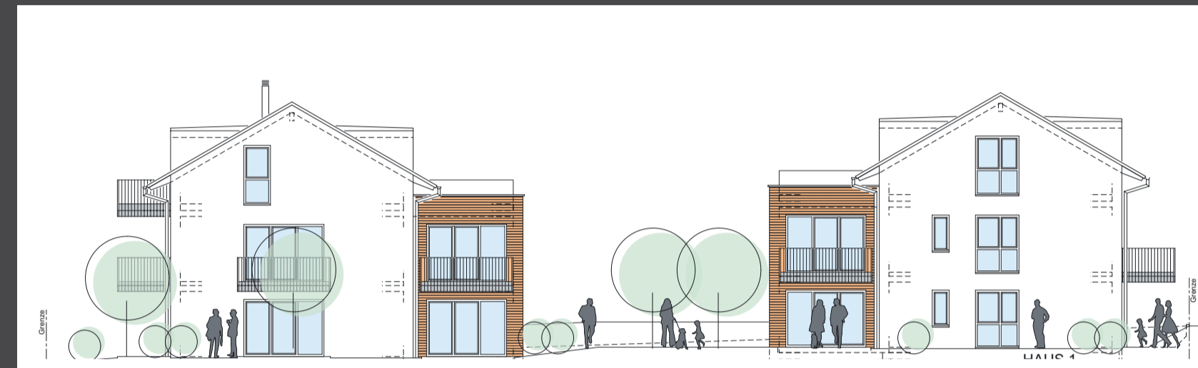
Neubau von zwei zusammenhängenden Mehrfamilienhäusern mit 13 Wohnungen in Ravensburg.