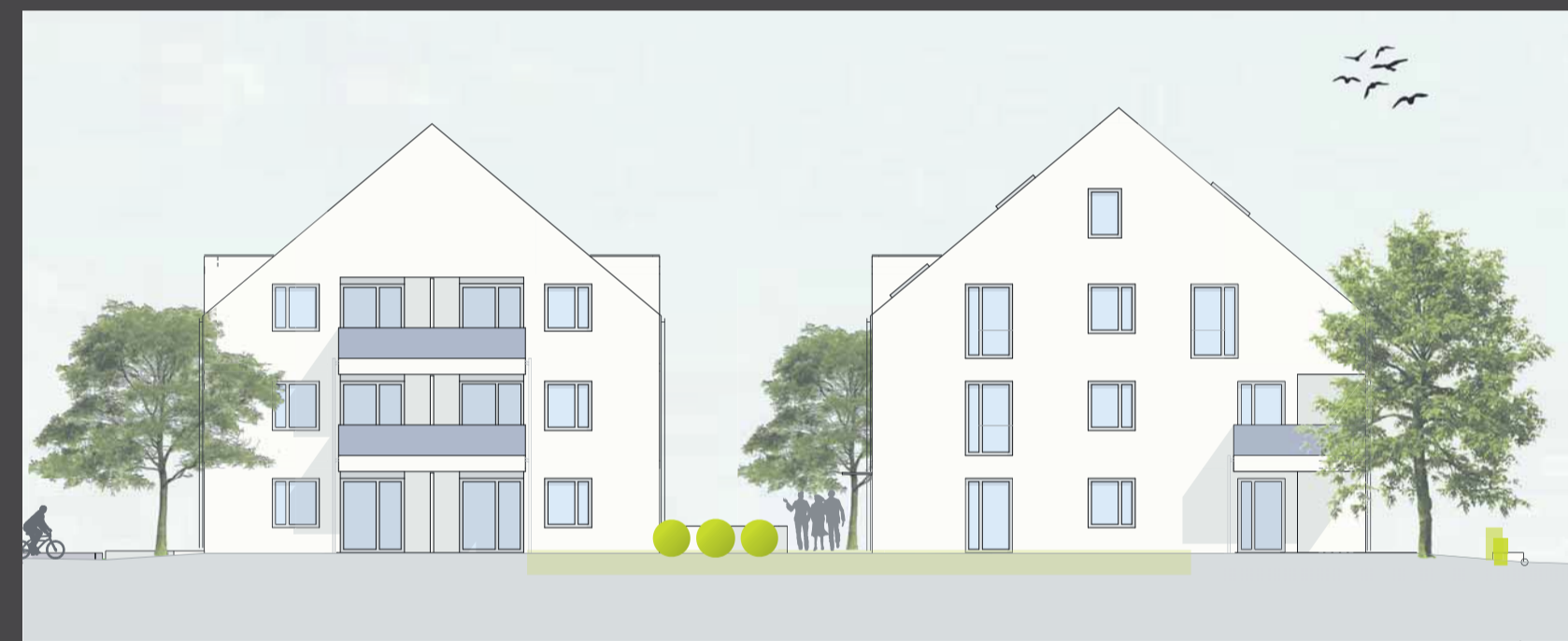
Neubau von zwei zusammenhängenden Mehrfamilienhäusern mit 17 Wohnungen in Weingarten.